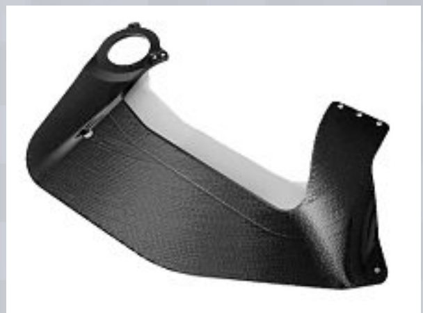
Bionisches Bauteil mit hochwertiger Oberfläche für den Maschinen- und Anlagenbau.

Das St. Galler Unternehmen Bionic Composite Technologies AG (Biontec), das hochwertige Faserverbundbauteile für Industriebranchen wie Maschinenbau, Sport sowie Mess- und Medizintechnik entwickelt und herstellt, hat ein neues Verfahren zur Fertigung hoher Stückzahlen entwickelt. Kriterien, welche das serientaugliche Verfahren erfüllen muss: Die Prozesse müssen schnell – also hochautomatisiert – aber auch hochpräzise ablaufen, so dass in der Produktion nur noch geringfügige Endbearbeitungen anfallen. Patin bei der Entwicklung dieses neuen Verfahrens stand die lange Tradition der Haute-Couture-Stickerei, aus der das Unternehmen Biontec einst hervorgegangen ist. Heute entwickelt das Unternehmen gemeinsam mit dem Kunden Bauteile nach bionischen Prinzipien. Was so viel heisst, dass die Fasern mittels industrieller Stickmaschinen vollautomatisiert im Krafftfluss orientiert und endkonturgetreu abgelegt werden können. Die Stickablagen werden dann maschinell ausgeschnitten, bevor sie in einem trockenen Verfahren zusammengefügt werden. Im Anschluss werden die gestickten Verstärkungen in einem geschlossenen Werkzeug mit einem flüssigen Kunststoff getränkt und ausgehärtet. So entstehen höchstpräzise Bauteile in kurzen Zyklen. Das spezielle Stick- und RTM-Verfahren wird von Biontec für jede